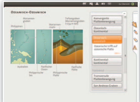
Durch interaktive Visualisierungen werden komplexe Zusammenhänge anschaulich dargestellt.