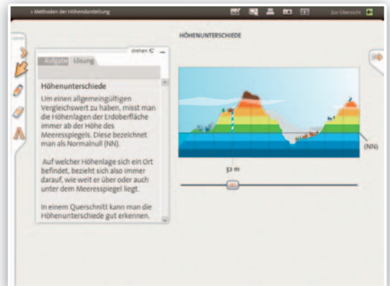
Die Lehrmodule zur Kartografie bieten anschauliche Darstellungen und interaktive Übungen.