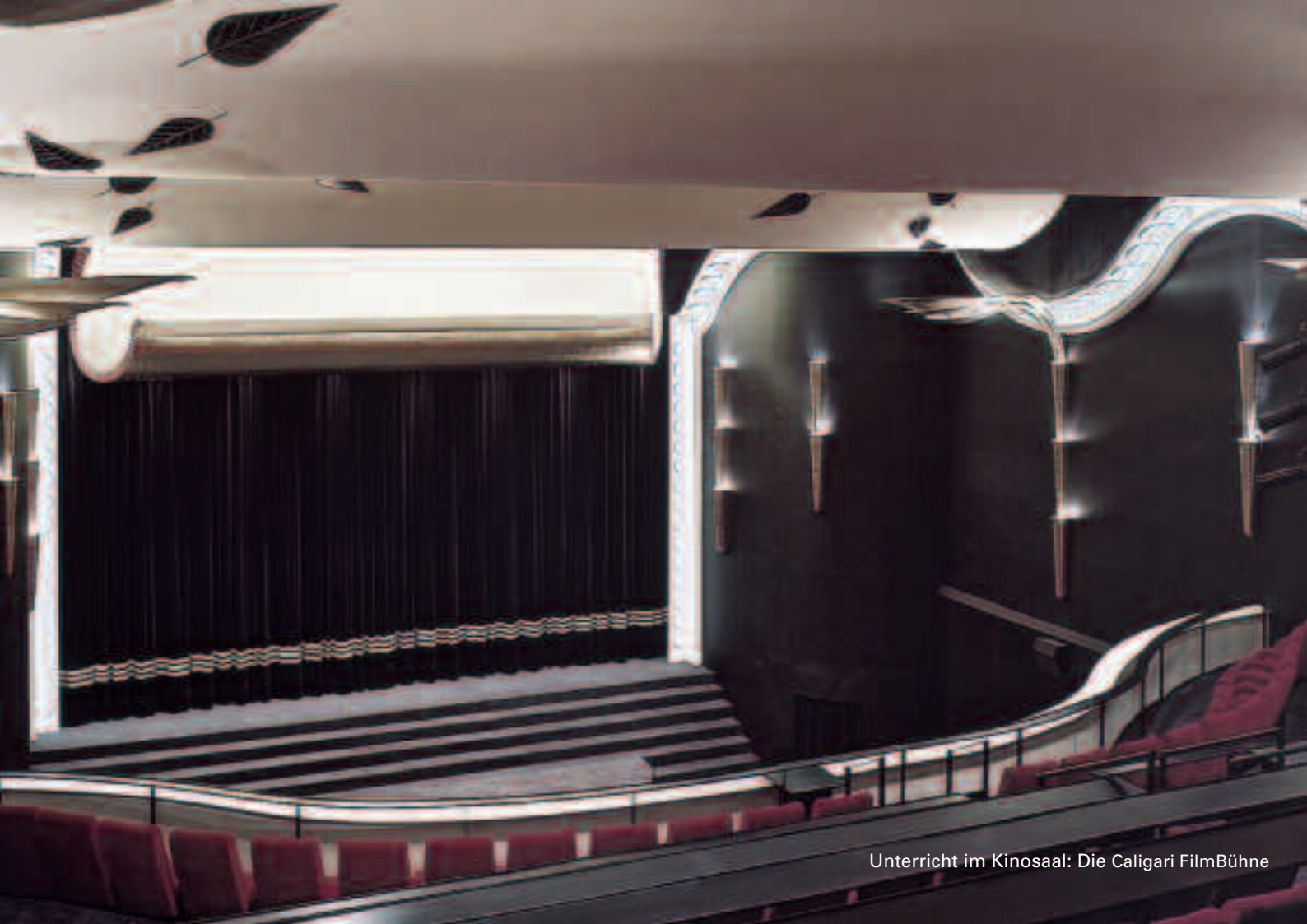
Unterricht im Kinosaal: Die Caligari FilmBühne