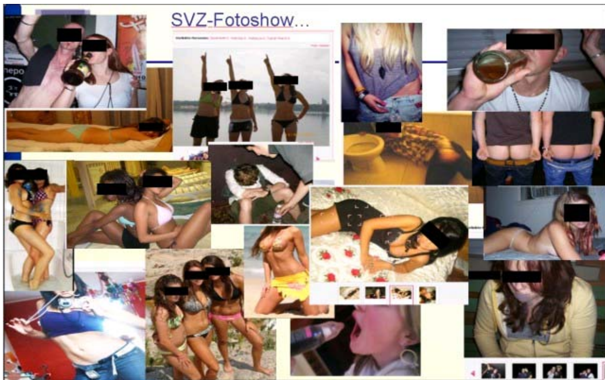
Collage von Fotos wie sie auf www.schuelervz.de zuhauf in ungeschützten Profilen zu finden sind