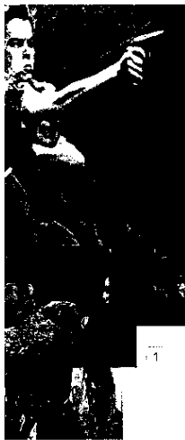
1 MOULIN ROUGE /ie: Baz Luhrmann (2001)

Wie ROMEO + JULIET erzählt auch MOULIN ROUGE eine tragische Liebesgeschichte, und in dem einen wie dem anderen Film ist L'amour ein Schriftzug, der in die Architektur eingebaut ist. Es geht um einen Rausch der Sinne, ein rauschhaftes Erleben, ein Nichtwissen, wo man ist, einen traumartigen Zustand. Aber auch hier gibt es Geschwindigkeitswechsel, Zeitlupen, Gefühlsverschiebungen, Wahrnehmungsänderungen. Wie in ROMEO + JULIET leitet sich das wieder aus